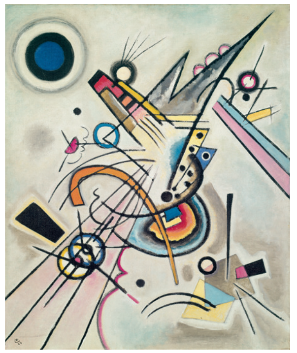
▲ Wassily Kandinsky DIAGONALE , 1923. Bildformat: 54,2 x 65,5 cm, Blattformat: 60 x 80 cm, 4-farbiger Druck im Hybrid-Verfahren auf Focus Art Natural-Papier Limitierte Auflage: 500 Exemplare, € 46,-

Die hochwertigen, rasterfrei reproduzierten Faksimile-Editionen geben die wertvollen Originale authentisch in Größe und Anmutung und mit höchstem Anspruch wieder: prachtvolle Blätter für Sammler und Kenner. Durch die aussergewöhnliche Drucktechnik wird der Ästhetik der Farbkombination und der Feinheit der Darstellung Rechnung getragen. Die Drucke erreichen eine vollendete, detailgetreue, struktur- und farbechte Wiedergabe, die dem Original augenscheinlich gerecht wird.