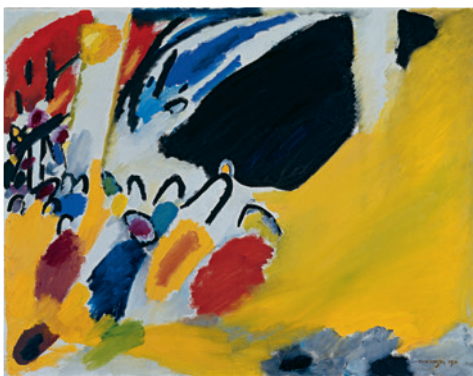
▲ Wassily Kandinsky, IMPRESSION III (KONZERT) , 1911 Bildformat: 54,1 x 42,2 cm, Blattformat: 67 x 48cm 4-farbiger Druck im Hybrid-Verfahren auf Focus Art Natural- Papier, € 34,-