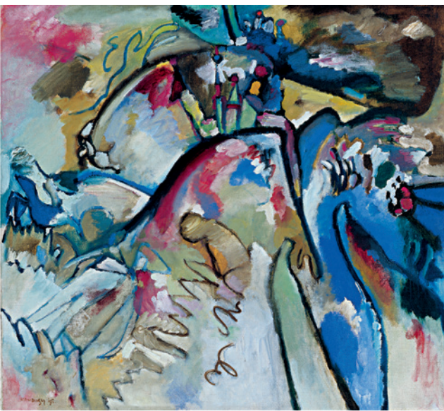
▲ Wassily Kandinsky, IMPROVISATION 21A , 1911 Bildformat: 45,5 x 41,1 cm, Blattformat: 60 x 48 cm, 6-8 farbiger frequenz- modulierter Druck auf 270 g Rives-Bütten, Limitierte Auflage: 500 Exemplare, © VG Bild-Kunst, Bonn 2008, € 78,-