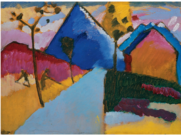
▲ Wassily Kandinsky KOCHEL – GERADE STRASSE , Herbst 1909 Bildformat: 44,8 x 33 cm, Blattformat: 60 x 48 cm, 5-farbiger Faksimile-Druck im frequenzmodulierten Druckverfahren, auf 270g Rives-Bütten Limitierte Auflage: 1.000 Exemplare, © VG Bild-Kunst, Bonn 2013, € 98,-