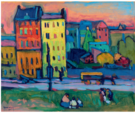
▲ Wassily Kandinsky, HÄUSER IN MÜNCHEN , 1908 Bildformat: 50,2 x 40,6 cm, Blattformat: 66 x 46 cm, 4-farbiger Druck im Hybrid-Verfahren auf Kunstdruckkarton € 34,-