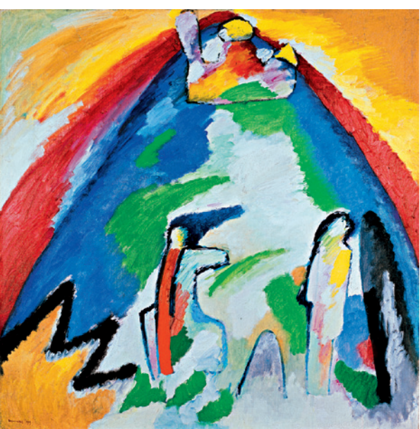
▲ Wassily Kandinsky, BERG , 1909 Bildformat: 43 x 43 cm, Blattformat: 48 x 60 cm, 6-8 farbiger frequenz- modulierter Druck, auf 270 g Rives-Bütten, Limitierte Auflage: 500 Exemplare, © VG Bild-Kunst, Bonn 2008, € 78,-