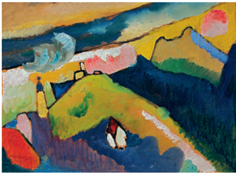
▲ Wassily Kandinsky, BERGLANDSCHAFT MIT KIRCHE , 1910 Bildformat: 50 x 36,5 cm, Blattformat: 60 x 46 cm 4-farbiger Druck im Offsetdruckverfahren auf LuxoArtSamt- Papier, © VG Bild-Kunst, Bonn 2013, € 34,-