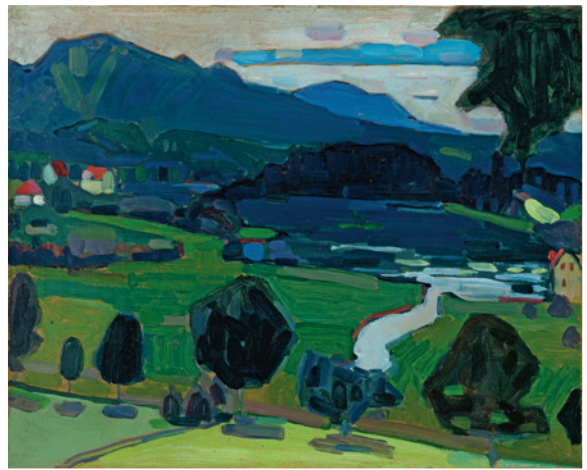
▲ Wassily Kandinsky MURNAU – BLICK ÜBER DEN STAFFELSEE , Sommer 1908 Bildformat: 40,5 x 32,5 cm, Blattformat: 60 x 48 cm, 5-farbiger frequenzmodulierter Faksimile-Druck , auf 270 g Rives-Bütten, Limitierte Auflage: 1.000 Exemplare, © VG Bild-Kunst, Bonn 2013, € 98,-