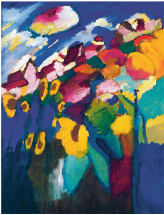
▲ Wassily Kandinsky, MURNAU GARTEN II , 1910, Bildformat: 51,6 x 67 cm, Blattformat: 60 x 80 cm, 5-farbiger Druck im Hybrid-Verfahren auf 260g Rives-Bütten Kunsthaus Zürich, Sammlung Gabriele und Werner Merzbacher, Limitierte Auflage: ? Ex: xxxx, € 128,-