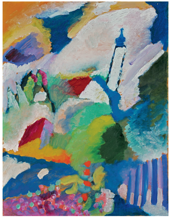
▲ Wassily Kandinsky MURNAU MIT KIRCHE I , Sommer 1910, Bildf.: 50 x 65 cm, Blattf.: 60 x 80 cm, 5-farbiger frequenzmodulierter Faksimile-Druck auf 270 g Rives-Bütten, Limitierte Auflage: 1.000 Ex., © VG Bild-Kunst, Bonn 2013, € 128,-