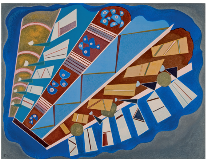
◀ Wassily Kandinsky MIT- UND AUF EINANDER , 1923, Bildformat: 59 x 46,4 cm, Blattformat: 78 x 57 cm, Farblithografie in 20 Farben auf 270 g Rives-Bütten, Limitierte Auflage: 500 Ex., © 1982 by A.D.A.G.P., Paris & Cosmopress, Genf, € 128,-