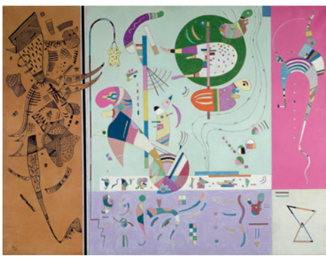
▲ Wassily Kandinsky, PARTIES DIVERSES , 1940 Bildformat: 55 x 42 cm, Blattformat: 67 x 48cm, 4-farbiger Druck im Hybrid-Verfahren auf Focus Art Natural-Papier, Dauerleihgabe/Eigentum der Gabriele Münter- und Johannes Eichner-Stiftung Städtische Galerie im Lenbachhaus und Kunstbau, München, © Bridgeman Images, € 34,-