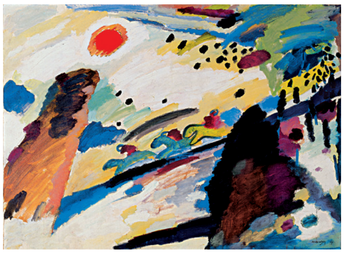
▲ Wassily Kandinsky ROMANTISCHE LANDSCHAFT , 1911, Bildf.: 57,1 x 41,2 cm, Blattformat: 67 x 48 cm, 6-8 farbiger frequenzmodulierter Druck, auf 270 g Rives- Bütten, Limitierte Auflage: 500 Exemplare , © VG Bild-Kunst, Bonn 2008, € 78,-