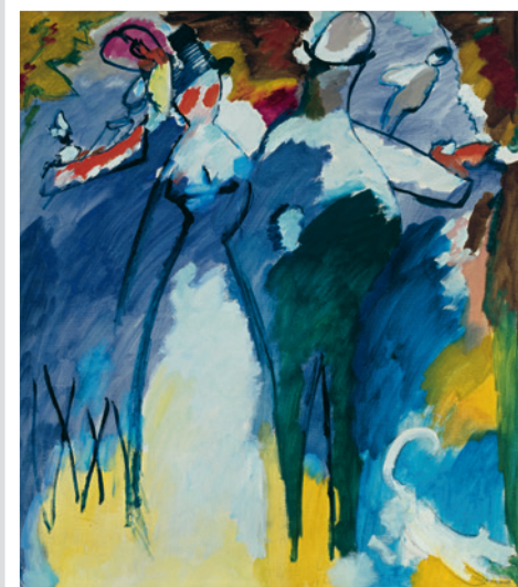
▲ Wassily Kandinsky IMPRESSION VI (SONNTAG) , 1911 Bildformat: 42,7 x 48,9 cm Blattformat: 48 x 67cm 4-farbiger Druck im Hybrid-Verfahren auf Focus Art Natural-Papier € 34,-