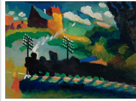
◀ Wassily Kandinsky EISENBAHN BEI MURNAU , 1909 Bildformat: 46,3 x 33,8 cm Blattformat: 60 x 48 cm 4-farbiger Druck im Offsetdruckverfahren auf LuxoArtSamt-Papier © VG Bild-Kunst, Bonn 2013 € 34,-