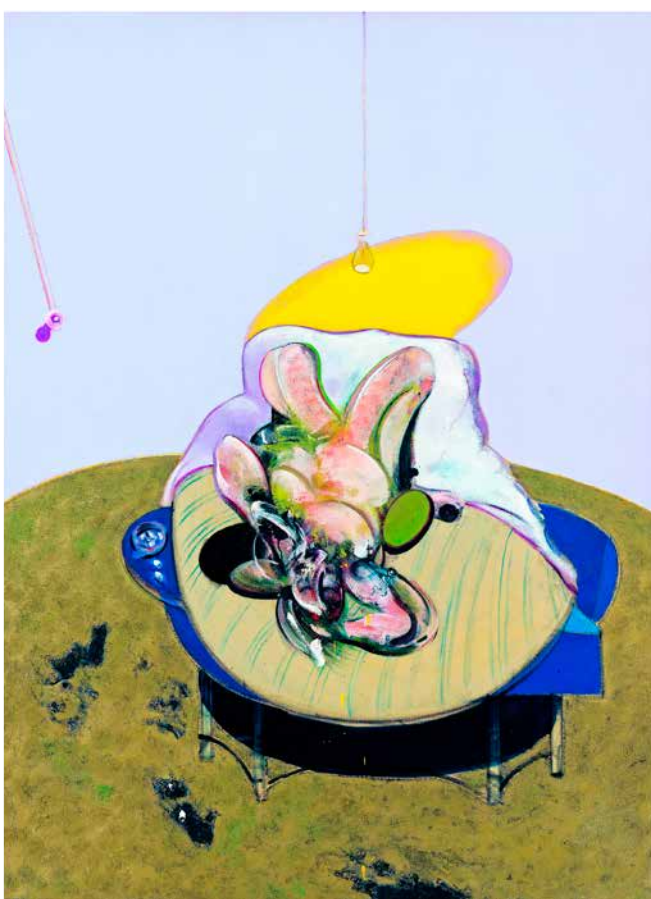
▲ Francis Bacon LYING FIGURE , 1969, Bildformat: 52 x 70,5 cm, Blattformat: 60 x 80 cm, 5-farbiger frequenzmodulierter Druck auf 260g Rives-Bütten, 1. Limitierte Druckauflage: 100 Ex. aus einer geplanten Gesamtauflage von 1.000 Ex. Fondation Beyeler, Riehen/Basel, Sammlung Beyeler, Foto: Robert Bayer, Basel, © The Estate of Francis Bacon. All rights reserved/VG Bild-Kunst, Bonn 2018 € 128,-