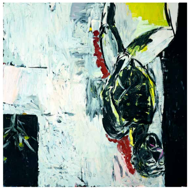
▲ Georg Baselitz WEG VOM FENSTER , 1982, Bildformat: 60 x 60 cm, Blattformat: 70 x 70 cm, 5-farbiger frequenzmodulierter Druck auf 260g Rives-Bütten, Limitierte Auflage: 250 Exemplare, © Georg Baselitz, 2018, Foto: Robert Bayer, Basel € 128,-

Francis Bacon (1909-1992) britischer Maler, einer der bedeutendsten gegenständlichen Maler des 20. Jahrhunderts.