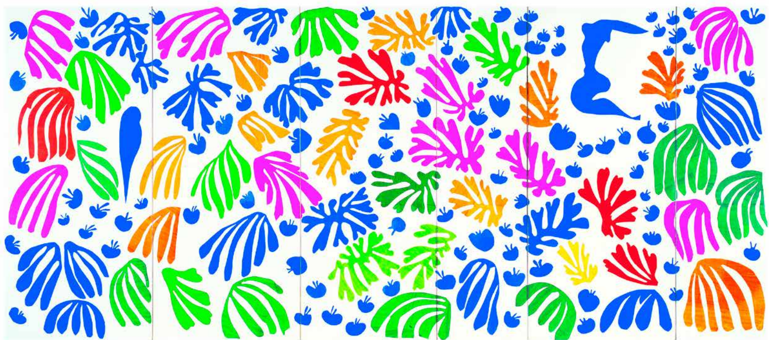
▲ Henri Matisse DAS PAPAGEIENWEIBCHEN UND DIE SIRENE , 1952 Bildformat: 90 x 39,5 cm, Blattformat: 98 x 67 cm 8-farbiger frequenzmodulierter Druck auf 260 g Rives-Bütten, © Succession H. Matisse / VG Bild-Kunst, Bonn 2018 € 168,-