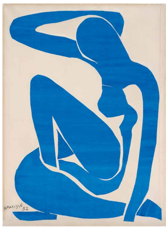
◀ Henri Matisse BLAUER FRAUENAKT I Bildformat: 53 x 72,5 cm Blattformat: 60 x 80 cm 5-farbiger frequenzmodulierter Druck auf 260 g Rives-Bütten © Fondation Beyeler, Riehen/Basel, Sammlung Beyeler, Foto: Robert Bayer, Basel, © Succession Henri Matisse / VG Bild-Kunst, Bonn 2016 € 128,-