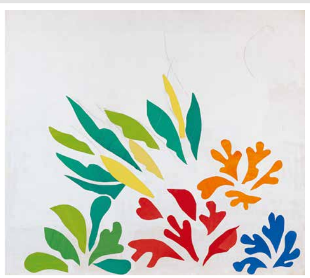
◀ Henri Matisse AKANTHES Bildformat: 47,5 x 42 cm Blattformat: 56 x 48 cm 5-farbiger frequenzmodulierter Druck auf 260 g Rives-Bütten € 98

Henri Matisse (1869 – 1954) war ein französischer Maler, Zeichner, Grafiker und Bildhauer. Er zählt mit zu den bedeutendsten Künstlern der Klassischen Moderne und war neben André Derain Wegbereiter und Haupt- vertreter des Fauvismus.