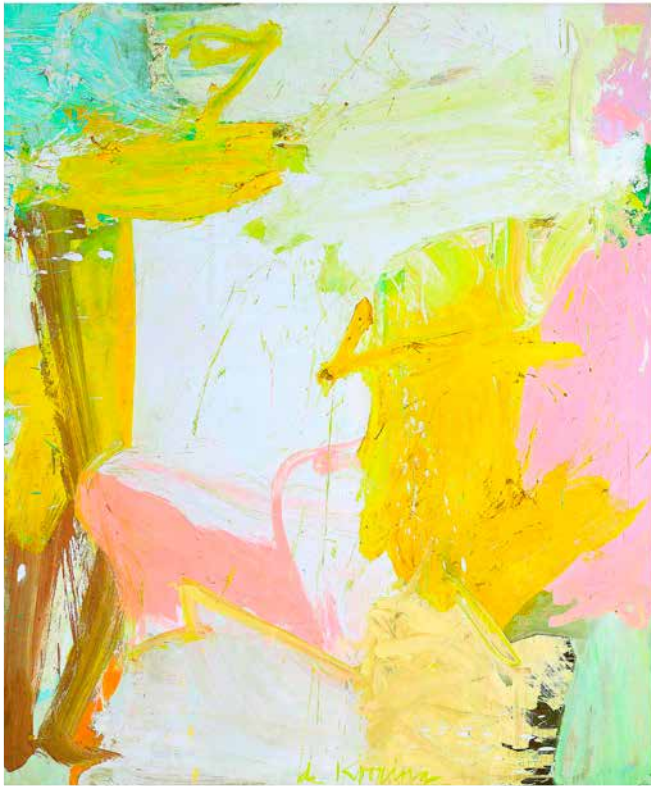
▲ Willem de Kooning ROSY-FINGERED DAWN AT LOUSE POINT , 1963, Bildformat: 52 x 58 cm, Blattformat: 60 x 80 cm, 4-farbiger Druck im frequenzmodulierten, Druckverfahren auf Focus Art Natural Papier, Stedelijk Museum Amsterdam © The Willem De Kooning, Foundation / VG Bild-Kunst, Bonn 2018 € 38,-

Willem de Kooning (1902-1997) niederländischer, ab 1962 US-amerikanischer Maler.