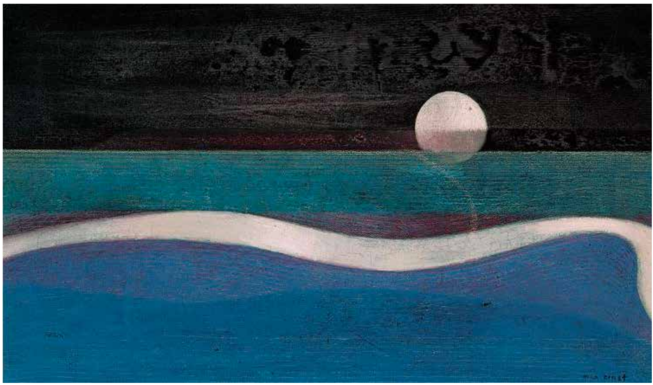
▲ Max Ernst HUMBOLDT STROM , 1951-52, Blattformat: 61 x 36 cm, Bildformat: xx cm, 5-farbiger Druck im Hybrid-Verfahren auf 260 g Rives-Bütten, Limitierte Auflage: 1.000 Exemplare, Fondation Beyeler, Riehen/Basel, Sammlung Beyeler, © Foto: Robert Bayer, Basel, © VG Bild-Kunst, Bonn 2019 € 98,-

Max Ernst (1891 – 1976) war ein bedeutender deutscher Maler, Grafiker und Bildhauer.