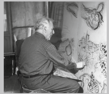
Marc Chagall in seinem Atelier in Paris.